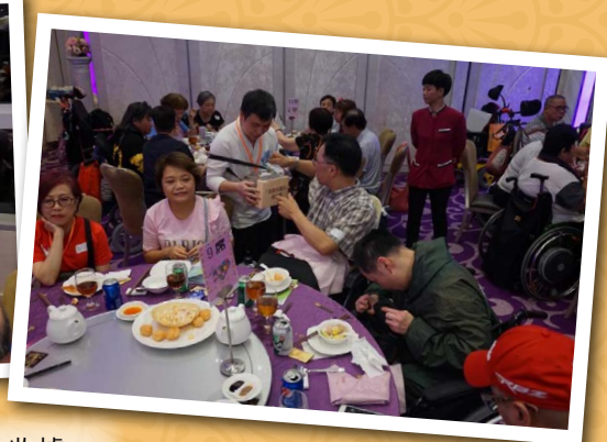
「7.7 無國界醫生日」籌款活動：捐款收據